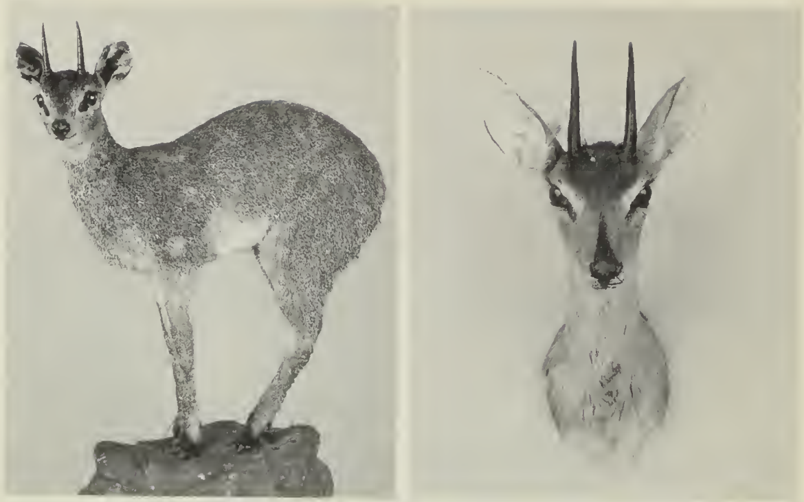
A sinistra: Saltarupe della Nigeria ( Oreotragus oreotragus porteousi Lidekker, 1911); a destra: Raficero campestre ( Raphicerus campestris Thunberg, 1811).

Raphicerus campestris Thunberg, 1811 - Raficero campestre - Steenbok: 3 teste di maschi adulti dell'Angola ed ascrivibili alla ssp. kelleni Jentink, 1990.